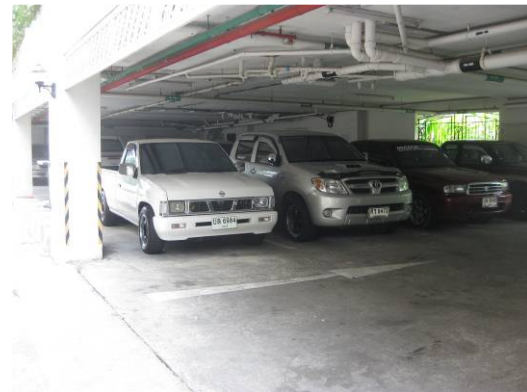
ภาพที่ 2-2 ที่จอดรถของพื้นที่โครงการ