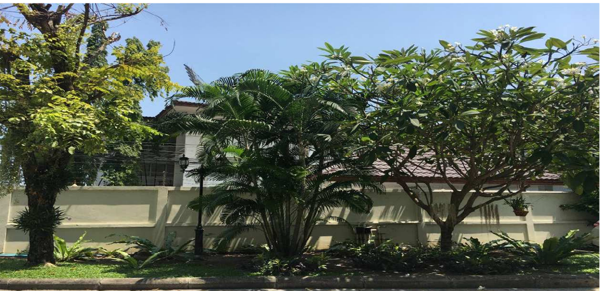
ภาพที่ 2-6 พื้นที่สีเขียวรอบพื้นที่โครงการฯ