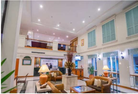
ภาพที่ 2-4 พนักงาน Reception ประจำโครงการฯ