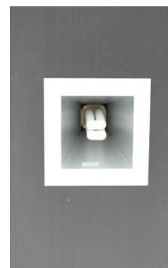
ภาพที่ 2-3 อุปกรณ์ประหยัดไฟฟ้าของโครงการ